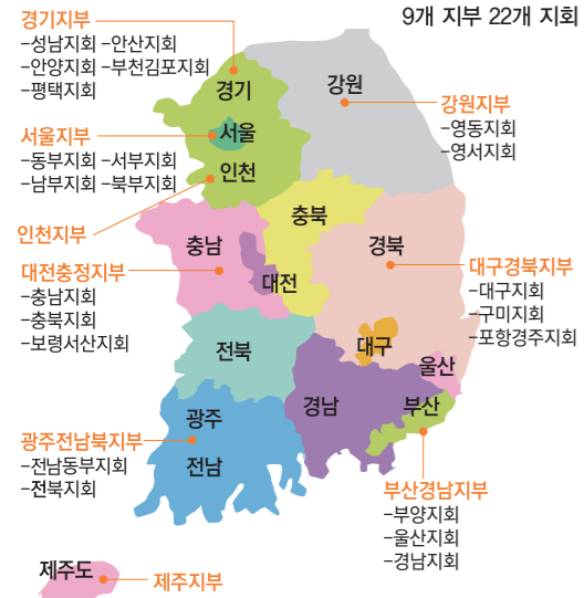
〈직업건강협회 지부지회 안내〉